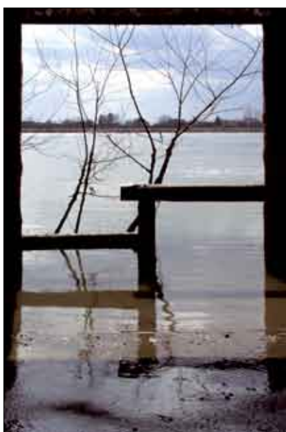
Siniša Graovac Prolećne vode 3