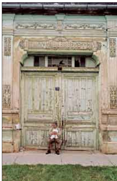
Aleksandar Plačkov Odmor ispred svoje kuće