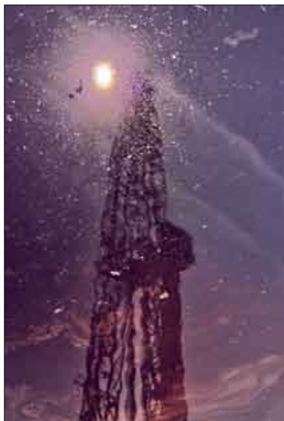
Siniša Kiršek Odsjaj sunca