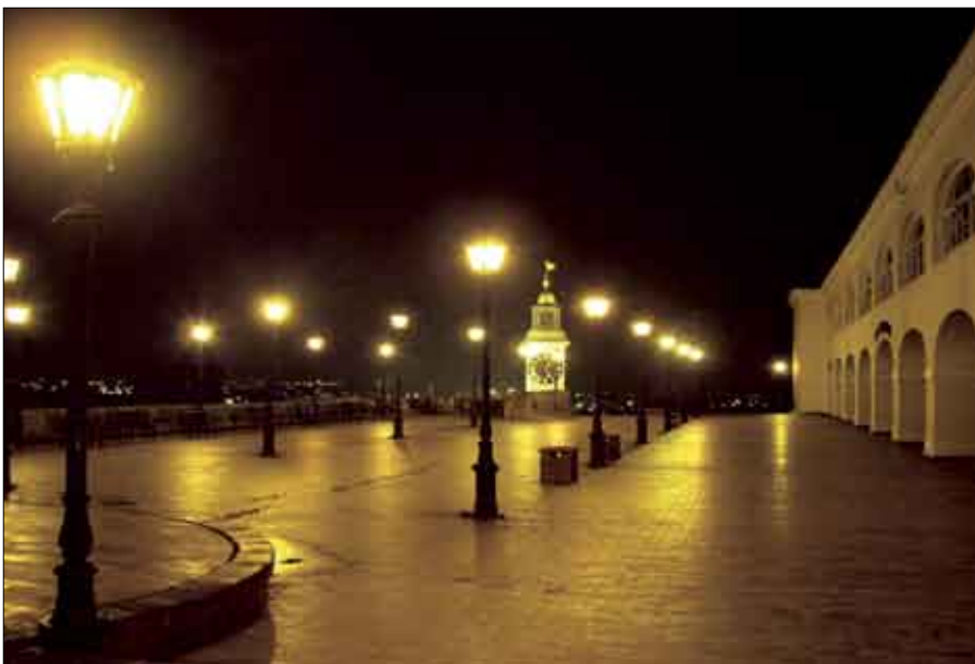
Siniša Bubnjević 05-05 AM