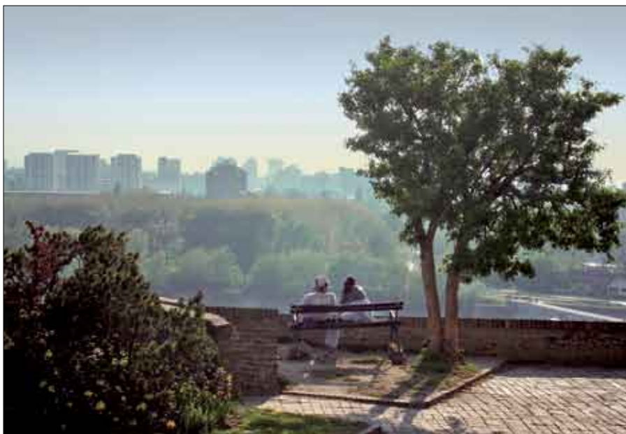
Vesna Stojaković Letnje popodne