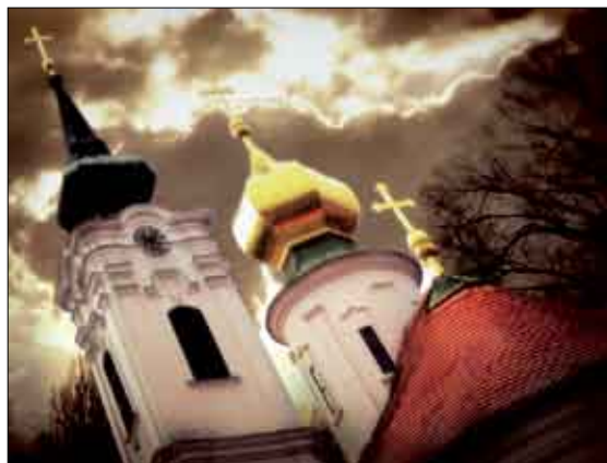
Zoran Stojaković Nikolajevska crkva