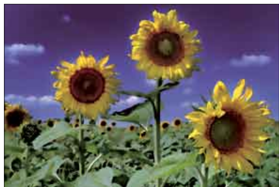
Dusan Živkić Suncokreti 42